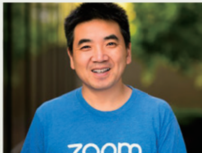
Zoom CEO Eric Yuan