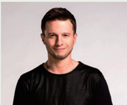
マット・フランコ

イベントをオンラインで配信いたしますが、その進行においては、ABCニュースのチーフであり、ビジネス、経済学、テクノロジー担当のレベッカ・ジャービス、KTLA 5ロサンゼルスキャスター、クリス・ショイブレが登場します。世界で絶賛されているマジシャン、マット・フランコが、イベントの中でちょっとした楽しい時間を提供します。