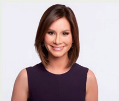
レベッカ・ジャービス