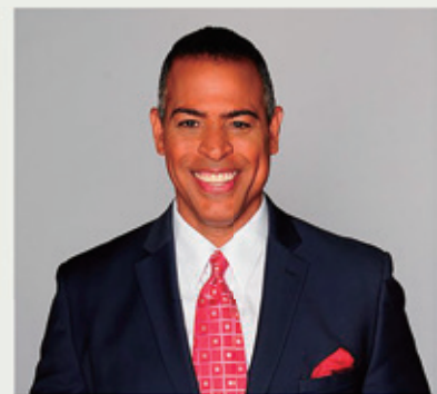
クリス・ショイブレ