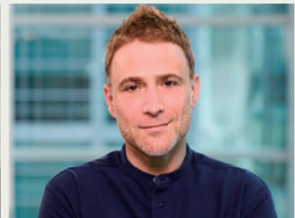
Slack CEO Stewart Butterfield